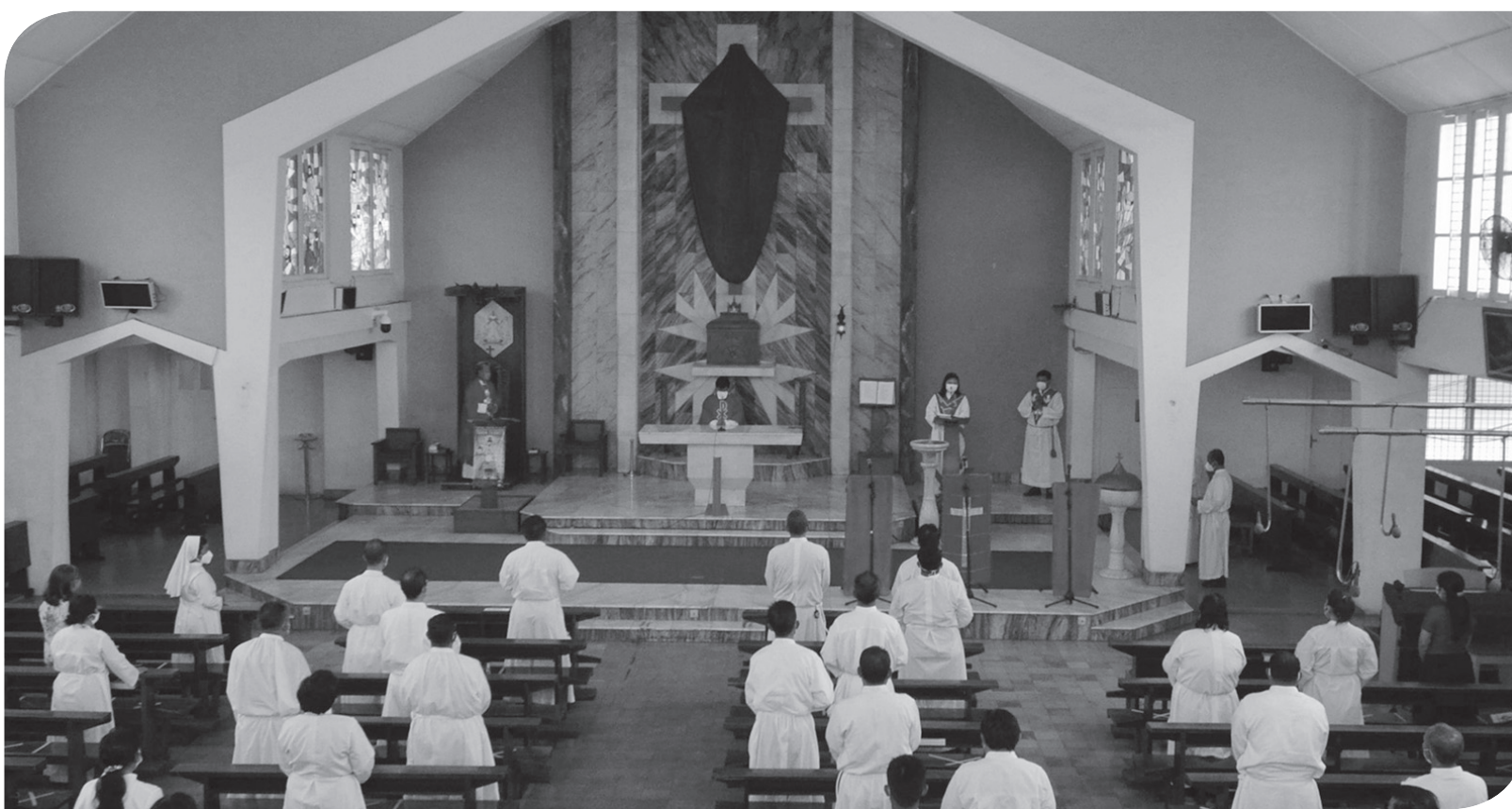
IBADAH JUMAT AGUNG

Ia mengatakan, sinergitas antara PKB dengan PB Al Khairiyah sudah sepatutnya saling membangun dan menggerakkan untuk kemashlahatan umat. "Kami memberikan saran dan masukan agar Perda Pondok Pesantren ini bisa membawa manfaat bagi aktivitas pondok yang ada di Banten," katanya. Dia juga berharap perda ini dapat memberikan peran pondok pesantren dalam pemberdayaan di bidang ekonomi kerakyatan. "Kami dari PB Al Khairiyah tentunya mendukung Perda ini, terlebih perda ini adalah inisiasi DPRD Banten," katanya. ● yan